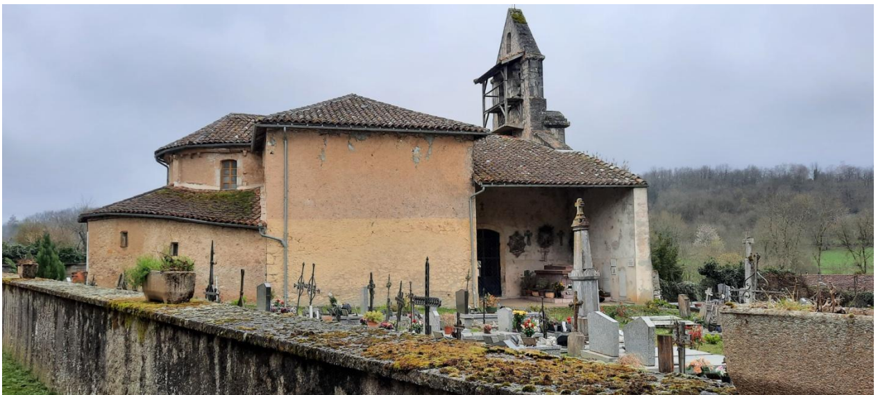
Eglise de Montseron