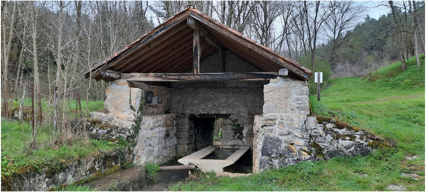
Lavoir de Francou