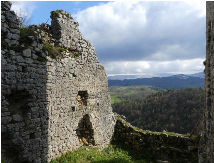
Château de Saint-Barthélémy